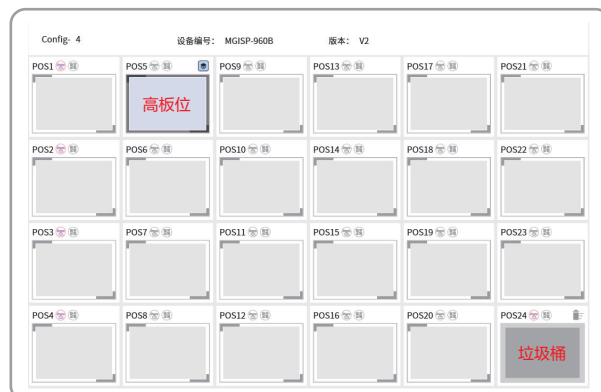
*空白板配置标准板位