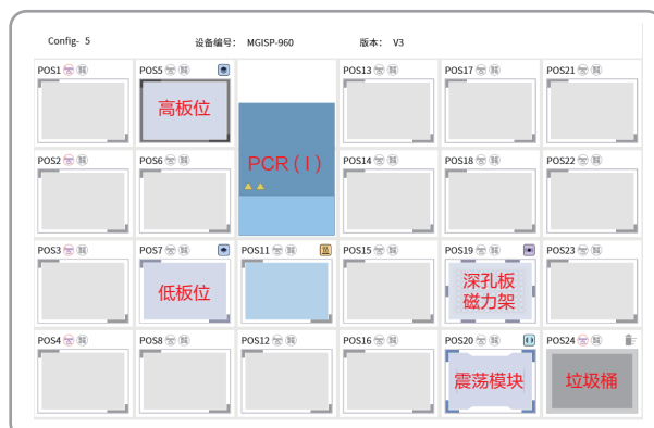
*空白板配置标准板位