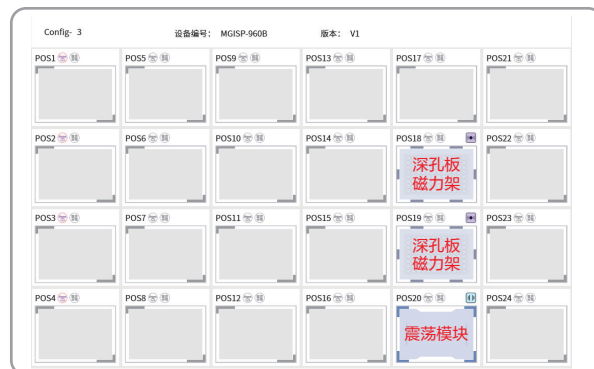
*空白板配置标准板位